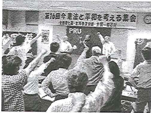
6・9「今憲法と平和を考える集会」。地本は、平和センター傘下の県内他労組と共に積極的に反戦平和の闘いに取り組んだ。

安倍政権は、昨年暮れに「特定秘密保護法」を強行可決し、今年七月には「集団的自衛権の行使容認を閣議決定」することによって、事実上憲法九条を破棄し、