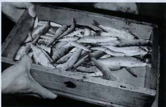
▲鵜が飲み込んで取った魚。

闇が深さを増すにつれ、吹く風も、流れる川も、刻一刻と表情を変える。その自然の変化と、目の前をいく鵜舟の動きに合わせて、握ったさおで観覧船を右へ