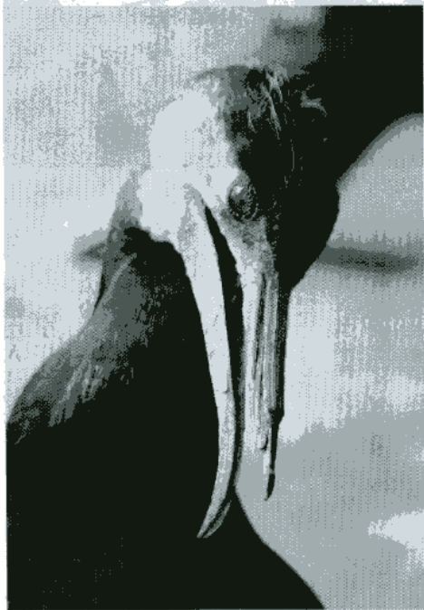
▲鵜飼に用いる鵜。死ぬまで鵜匠と一緒に暮らす。

の宅地内にある鳥屋で暮らす。その扱いは丁重で、鵜匠は毎朝、鵜とふれあい、その体調をチェックし、信頼関係を築く。お疲れ気味の鵜には「休暇」もある。 年2回、鵜の「健康診断」もある。というのも「皇室御用」の長良川の鵜飼では、皇室に献上する鮎を取る「御料鵜飼」が行われるからだ。病気持ちの鵜が飲ん