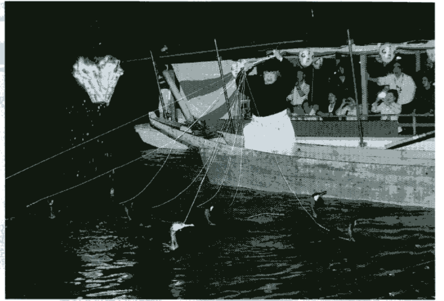
▲長良川の「鵜飼」。1300年の歴史を持つ古典漁法で、闇の中に幻想的な空間が浮かび上がる。