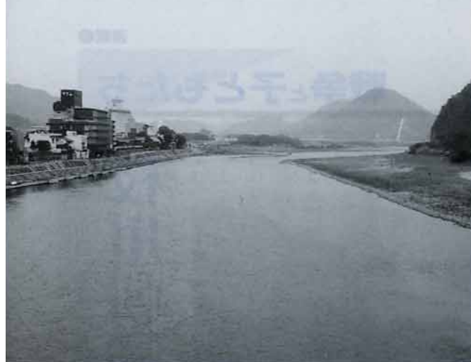
▲清冽な流れをたたえる長良川。

「今ある雇用も労働条件も、組合があることで守られている。でも、そのことがなかなか組合員に見えない。悩ましいですねえ」。職人さんの労組もサラリーマンの労組も、悩みは同じようだ。